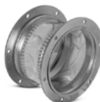
FLEKSIBILNA VEZA SA PRIRUBNICAMA