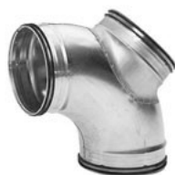
SEGMENTNO KOLJENO SA REVIZIONIM OTVOROM