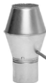
KROVNA VENTILACIONA KAPA