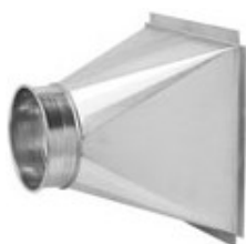
REDUKCIJA SA PRAVOUGAONIKA NA KRUG